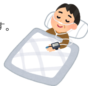
終夜睡眠ポリグラフィ検査イメージ

治療方法も確立されておりますので、適切な検査・治療を行うことで改善されます。 症状に心当たりある方はお気軽に当院までにご相談ください。